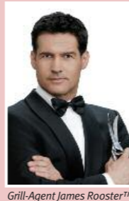
Grill-Agent James Rooster™