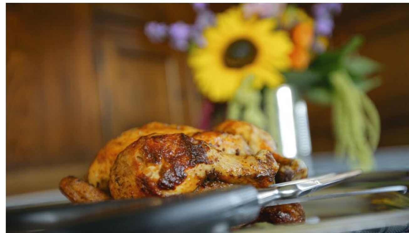
Hochwertiger Eiweiss-Lieferant: Das beste Schweizer Grill-Poulet NATURA GÜGGELI.

Der Umfang des Trainings hat selbstverständlich ebenfalls einen Einfluss auf die Ernährung. Wer Marathon läuft, hat andere Bedürfnisse als ein Hobbysportler, der 3 Stunden wöchentlich trainiert. Für einen Hobbysportler, der zur Fitness und/oder Gewichtsoptimierung trainiert, bietet eine eiweissreiche und kohlenhydratreduzierte Ernährung zwar eine Umstellung, jedoch eine relativ schnelle Verbesserung der Fettverbrennung. Das Plus an Eiweiss sorgt zudem dafür, dass Muskeln wachsen und nicht als Energiequelle beigezogen werden. Auch der sogenannte «Hungerast» nach dem Training lässt sich durch eine verbesserte Fettverbrennung gut in den Griff bekommen. Dadurch, dass neben Kohlenhydraten auch vermehrt Fette verbrannt werden, leeren sich nicht sämtliche Kohlenhydratspeicher, was zu starkem Hunger und Leistungsabfall führen würde.